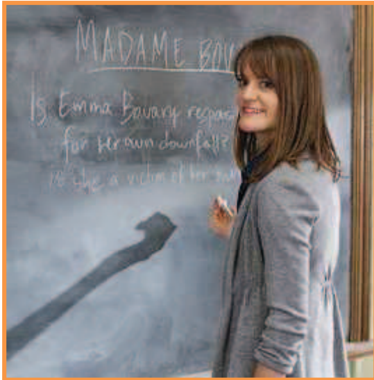
Sara en una escena de Pretty Little Liars, el programa de TV basado en su serie de libros.

Cuando Sara Shepard era joven, las cosas que quería ser cuando creciera eran: Estrella de telenovelas, diseñadora de LEGO, directora de cine, artista de plastilina, genetisista, editora de revistas de moda y, mas que nada, escritora.